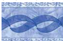
OLYMPIA MODRÁ PÁSEK výška: 24 cm, dĺžka: 33 m, tl. 1,2 mm