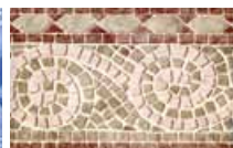
GENOVA OKROVÁ PÁSEK výška: 24 cm, dĺžka: 33 m, tl. 1,2 mm