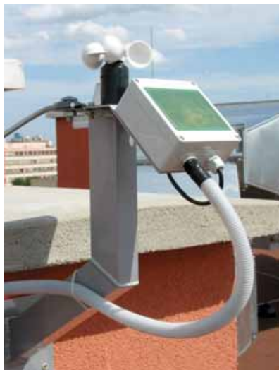
snímač dažďa a vetra